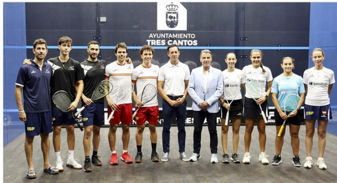
La delegación española que acudirá al Europeo de Chartres (Francia), que se disputa del 20 al 23 de agosto, compuesta por cuatro hombres y cuatro mujeres.