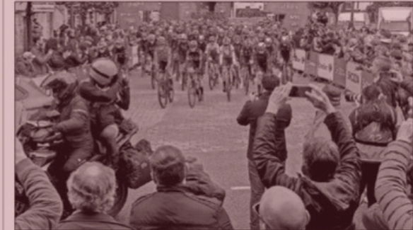
Varios fotógrafos immortalizan la salida de una de las etapas de la pasada edición de La Vuelta.